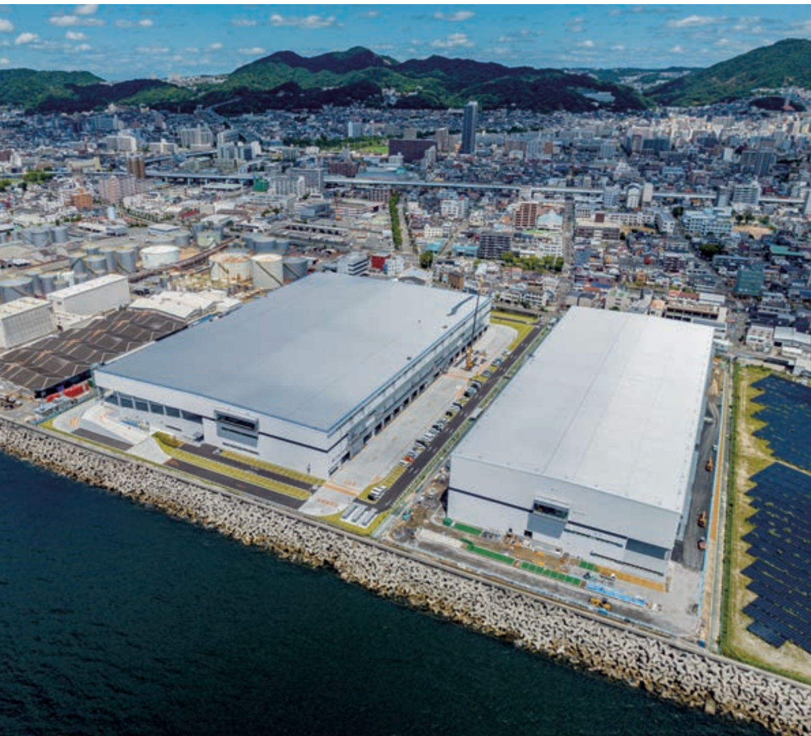
神戸西流通センター